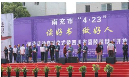
南充市总分馆建设